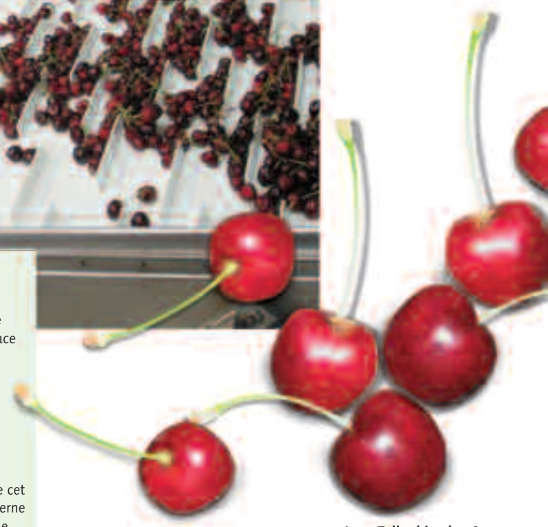
Les «Tellenkirschen®» sont volumineuses et ont beaucoup de goût

Manque d'arbres Le plus grand problème réside actuellement dans l'acquisition de matériel de plantation certifié.